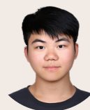
馬賀 基督教永愛教會