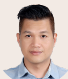
江金田 花蓮志學博愛浸信會