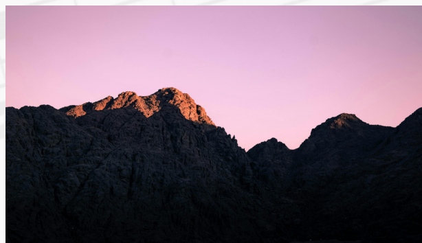
圖 | 西乃山的黃昏

從聖經歷史可見，敬拜本質上是上帝子民的群體行動。當以色列人出埃及來到西乃山時，上帝宣告他們是祂揀選的「祭司的國度、聖潔的國民」，並吩咐全體百姓預備自己來朝見祂（出 19:1-15）。祂又指示：「為我招聚百姓，使他們聽見我的話，學習敬畏我，並教導兒女如此行」（申 4:10）。可見，敬拜從起初就是向整個信仰群體發出的召命，而非僅個別信徒的靈性經驗。