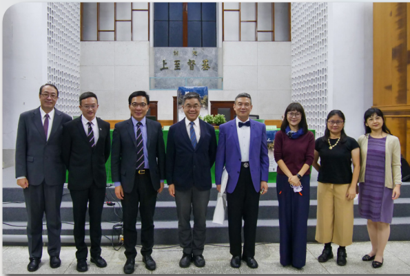
第一天發表人與回應人合影