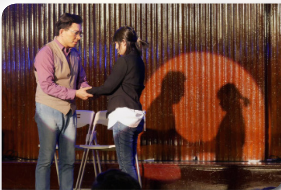
浸神師生劇團戲劇演出

透過戲劇中的真實故事，映照出屬於各自的生命故事，或許它會在你生命塵封的某處，成為你的亮光和支持。