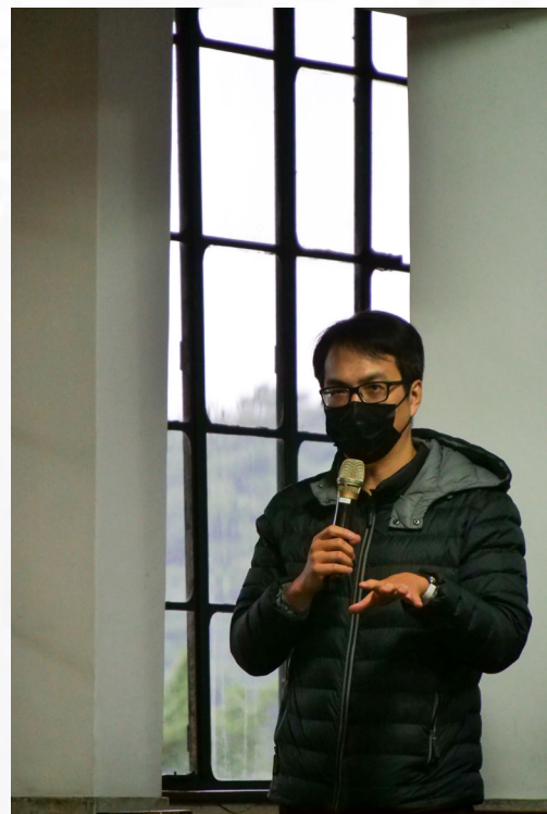
圖 | 作者於學術發表會中提問

我感謝神，在我服事多年後，為了裝備我完成下一階段的呼召，上帝帶我來到屬於我的伊頓——基督教台灣浸會神學院。主啊！我願意！