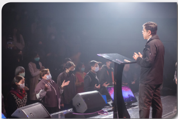
聽見主的呼召 人就回應祂的心意

在五個城市中，我們講述一個「神呼召人，人回應神」的動人故事。當我們聽見主的呼召，我們是否願意撇棄一切來回應主的心意呢？