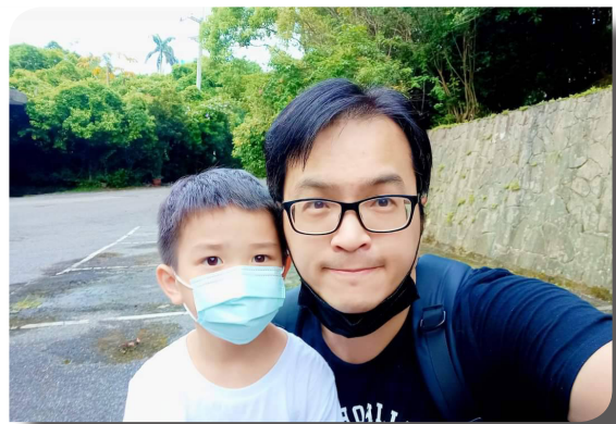
圖 | 作者與其子合影於聖樂館外

當時因著神的恩典和教會的代禱，我順利地在台大機械系一路從大學念到博士。但就在這段期間，教會也經歷了一連串的動盪，並出現許多人才青黃不接的情況。當時我在朦朧懂懂的情況下，陸續承擔起了教會大部分的講台宣講、教導、牧養和領導管理等等事奉。