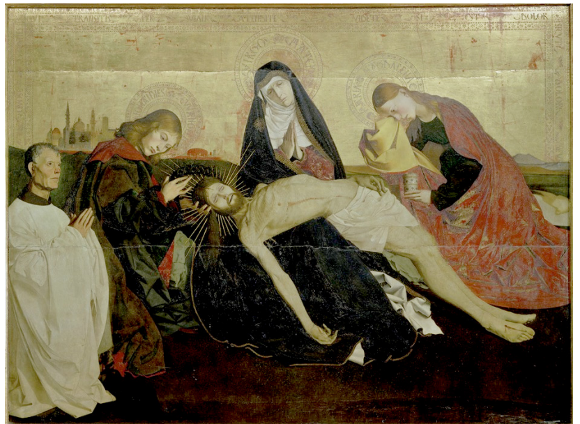
La Pietà de Villeneuve-lès-Avignon (c. 1455)