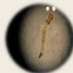
白線斑蚊及其子子