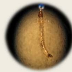
埃及斑蚊及其子子